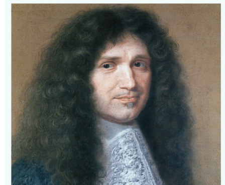
Jean-Baptiste Colbert (1619-1683)