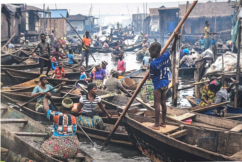
1 Un bidonville à Lagos (Nigeria)

L'Afrique connaît une forte augmentation de sa population, qui va se poursuivre dans les prochaines décennies. Selon les projections, la population africaine représentera 25 % de la population mondiale en 2040.