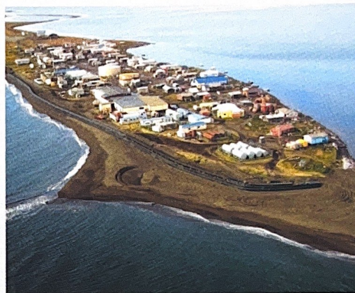
Le village de Kivalina (Alaska)

La seule issue possible pour Kivalina est de mettre en œuvre un déménagement