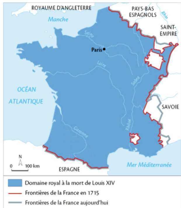
Le royaume au temps de Louis XIV