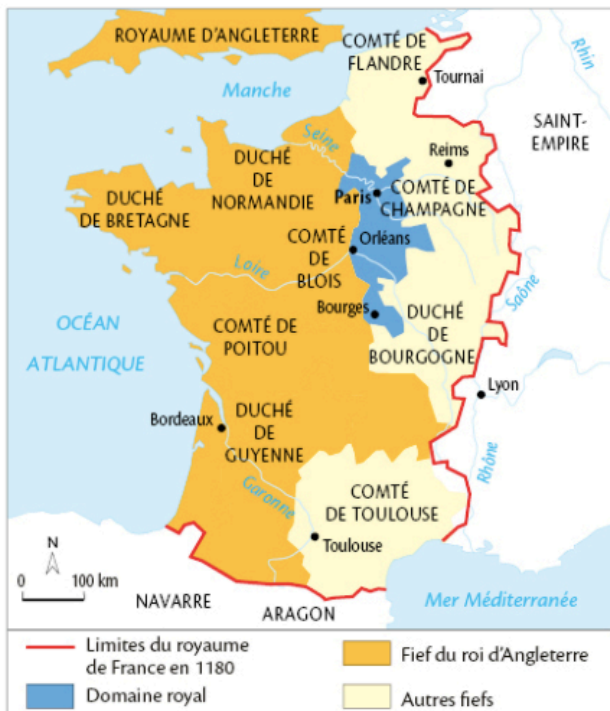
Le royaume de France à l'avènement de Philippe Auguste (1180)

A. Se repérer dans l'espace - répondez rapidement aux questions.